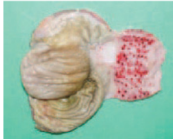
Filigisi iliyovia damu.